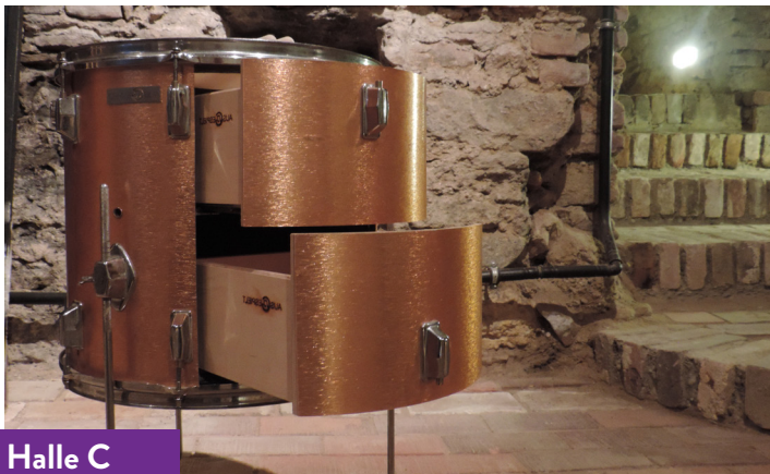
Halle C Stand U07