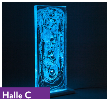
Halle C Stand U04

Daniel Bucur Gols, Österreich www.bucur.at