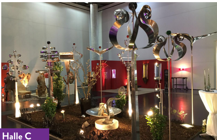
Halle C Stand U08