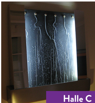
Halle C Stand U05