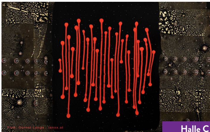
Halle C Stand U06

Gerhard Zsambok Wien, Österreich www.wasserkunst.at