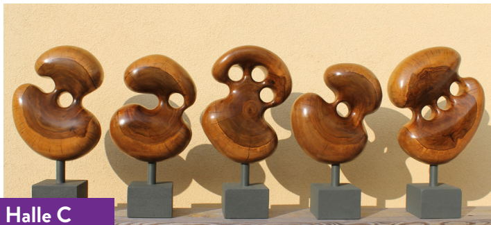
Halle C Stand U03